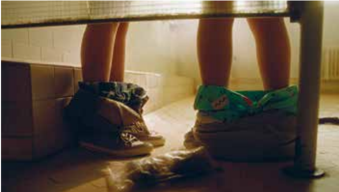
Pukuhuoneessa tuksahtaa musta huumori.