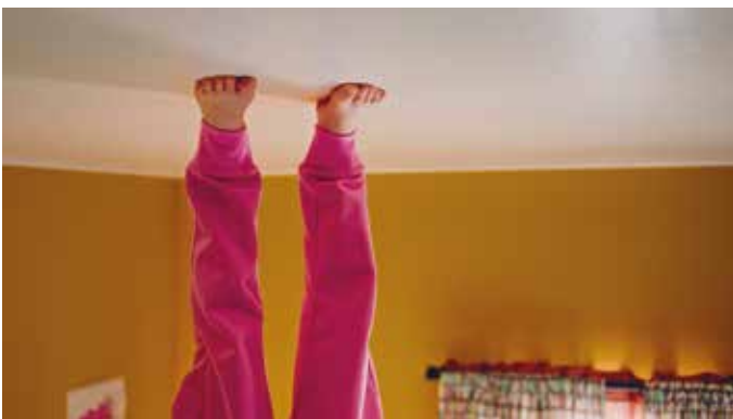
Feet up esittelee uusia, käteviä sisustusratkaisuja.

ystävyyys, menetys, kirjasta elokuvaksi, animaatio